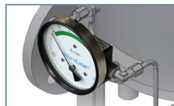
Differenzdruckanzeige komplett montiert